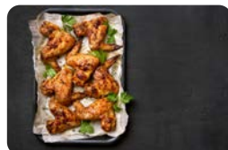
Cremiger Brokkoli mit Chicken Wings