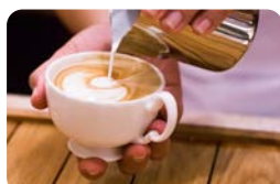
Kaffee mit Sahne