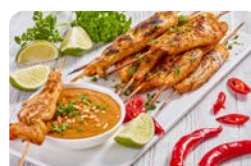
Hühnchen-Spieß mit Erdnuss- Soße

F: Kohlenhydrate: 4 g; Fett: 34,2 g; Protein: 3,2 g → kcal: 328 M: Kohlenhydrate: 5 g; Fett: 44 g; Protein: 26 g → kcal: 517 A: Kohlenhydrate: 10 g; Fett: 40 g; Protein: 30 g → kcal: 660