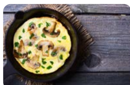
Omelett mit Pilzen