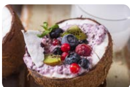
Kokosnusscreme mit Beeren