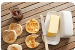
Englische ketogene Muffins