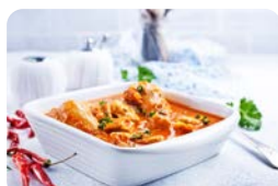
Hähnchen Garam Masala