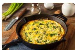
Frittata mit drei Käsesorten