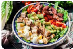
Salat mit Ranch-Dressing