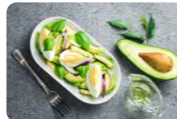
Eier mit Avocado

F: Kohlenhydrate: 12 g; Fett: 24 g; Protein: 10 g → kcal: 302 M: Kohlenhydrate: 6 g; Fett: 81 g; Protein: 43 g → kcal: 945 A: Kohlenhydrate: 1 g; Fett: 19 g; Protein: 11 g → kcal: 316