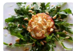
Ziegenkäsesalat mit Balsamico-Butter

F: Kohlenhydrate: 10 g; Fett: 34 g; Protein: 20 g → kcal: 426 M: Kohlenhydrate: 2 g; Fett: 20 g; Protein: 12,5 g → kcal: 235 A: Kohlenhydrate: 3 g; Fett: 73 g; Protein: 37 g → kcal: 842