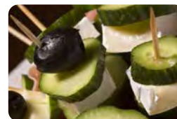
Gurken mit würzigem Käse

F: Kohlenhydrate: 7 g; Fett: 72 g; Protein: 26 g → kcal: 810 M: Kohlenhydrate: 7 g; Fett: 46 g; Protein: 21 g → kcal: 540 A: Kohlenhydrate: 2 g; Fett: 20 g; Protein: 26 g → kcal: 243