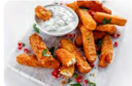
Käse-Pommes mit cremigem Dip