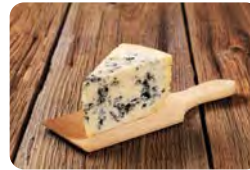
Keto-Pasta mit Blauschimmelkäse

F: Kohlenhydrate: 9 g; Fett: 25 g; Protein: 3 g → kcal: 260 M: Kohlenhydrate: 7 g; Fett: 45 g; Protein: 44 g → kcal: 350 A: Kohlenhydrate: 10 g; Fett: 84 g; Protein: 35 g → kcal: 943