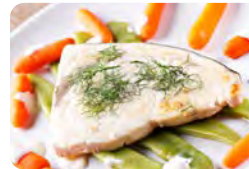
Gebrautener Fisch mit Walnuss-Dip

F: Kohlenhydrate: 4 g; Fett: 59 g; Protein: 16 g → kcal: 661 M: Kohlenhydrate: 7 g; Fett: 25 g; Protein: 15 g → kcal: 312 A: Kohlenhydrate: 7 g; Fett: 48 g; Protein: 48 g → kcal: 660