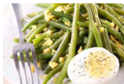
Bohnensalat mit Ei

F: Kohlenhydrate: 8 g; Fett: 50 g; Protein: 50 g → kcal: 750 M: Kohlenhydrate: 9 g; Fett: 14 g; Protein: 17 g → kcal: 225 A: Kohlenhydrate: 10 g; Fett: 23 g; Protein: 20 g → kcal: 340