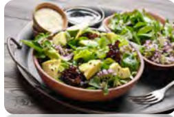
Feldsalat mit leckerer Zwiebelcreme